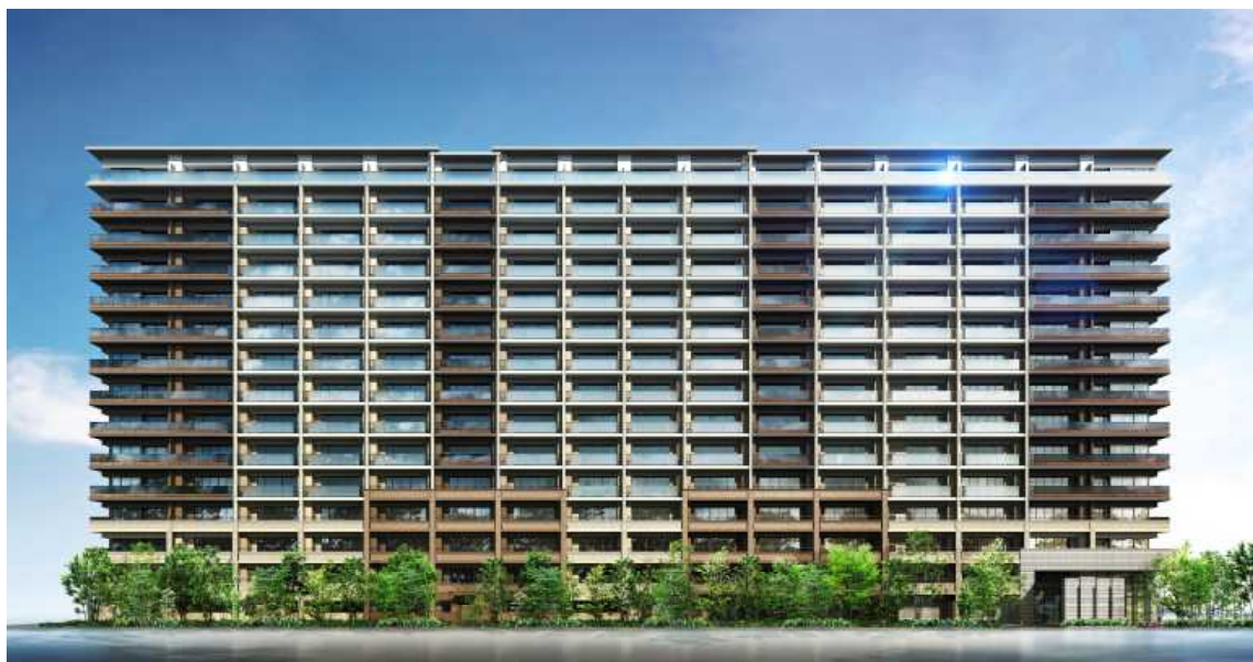
完成予想 CG パース